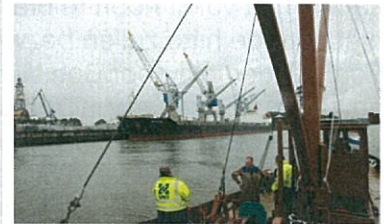
Op weg naar Loggerfestival

In de afgelopen periode is ondanks veel restauratiewerk toch tijd gevonden om deel te nemen aan evenementen als de Sleepbootdag Maassluis en het Loggerfestival in Vlaardingen. Tijdens de sleepbootdag in mei is flink wat gevaren. Behalve de highlights die de voorzitter hierboven al noemde zijn nog tal van andere klussen uitgevoerd. Het ontroesten en conserveren van de voorpiek bleek een zwaar karwei. Maar wel erg nodig want we willen binnenkort de voorpiek vullen met 5 ton ballast om daarmee de trimligging van de 'Bruinvisch' weer in overeenstemming met het verleden te brengen. Het anker, de kluis en de kettingkoker zijn weer zoals het hoort. We hopen deze winter de ankerlier te laten restaureren op de technische school in Brielle. De permanente voeding door walstroom leidde tot corrosie van de scheepshuid. Door de, opnieuw, geweldige medewerking van Bakker Sliedrecht hebben we de hand kunnen leggen op een broodnodige scheidingstransformator die dat gaat voorkomen. De aanstaande verhuizing naar een drijvende steiger in de binnenhaven leidt tot aanpassing van ons plan. Het blijkt niet toegestaan om daar een drie-fasen aansluiting te realiseren. Walvoeding met een enkele fase van maximaal 17 Ampère betekent een grondige herziening van ons elektrisch bedrijf. Een elektrische boiler is bijvoorbeeld niet meer mogelijk en dus moet het verwarmingssysteem worden herzien. Enfin als de ligplaats maar goed is.