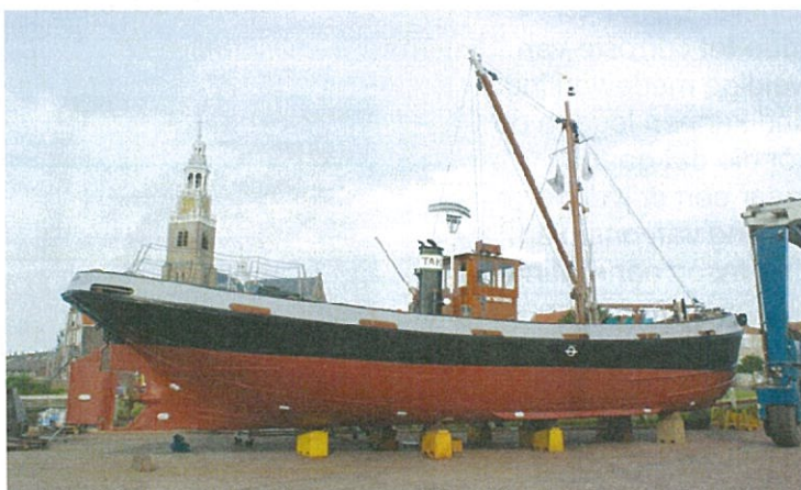
Vlak voor tewaterlating

Marjorystraat 11, 3151JK Hoek van Holland www.bruinvisch.nl / info@bruinvisch.nl