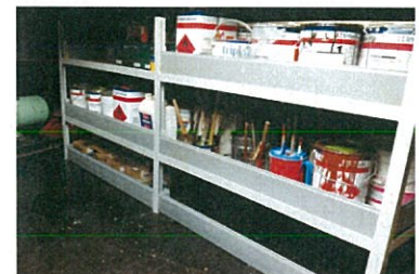
Verfrek in achterruim

In de afgelopen periode is ondanks veel restauratiewerk toch tijd gevonden om deel te nemen aan evenementen als de Sleepbootdag Maassluis en het Loggerfestival in Vlaardingen. Tijdens de sleepbootdag in mei is flink wat gevaren. Behalve de highlights die de voorzitter hierboven al noemde zijn nog tal van andere klussen uitgevoerd. Het ontroesten en conserveren van de voorpiek bleek een zwaar karwei. Maar wel erg nodig want we willen binnenkort de voorpiek vullen met 5 ton ballast om daarmee de trimligging van de 'Bruinvisch' weer in overeenstemming met het verleden te brengen. Het anker, de kluis en de kettingkoker zijn weer zoals het hoort. We hopen deze winter de ankerlier te laten restaureren op de technische school in Brielle. De permanente voeding door walstroom leidde tot corrosie van de scheepshuid. Door de, opnieuw, geweldige medewerking van Bakker Sliedrecht hebben we de hand kunnen leggen op een broodnodige scheidingstransformator die dat gaat voorkomen. De aanstaande verhuizing naar een drijvende steiger in de binnenhaven leidt tot aanpassing van ons plan. Het blijkt niet toegestaan om daar een drie-fasen aansluiting te realiseren. Walvoeding met een enkele fase van maximaal 17 Ampère betekent een grondige herziening van ons elektrisch bedrijf. Een elektrische boiler is bijvoorbeeld niet meer mogelijk en dus moet het verwarmingssysteem worden herzien. Enfin als de ligplaats maar goed is.