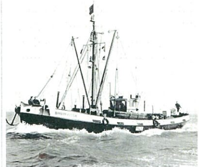
Bruinvisch anno 1956

In de vorige nieuwsbrief meldde ik dat de eindspurt van de restauratie van de 'Bruinvisch' was gestart. In de afgelopen maanden zijn bergen werk verzet en het resultaat mag er wezen. De bergingspomp is geplaatst en door een koppeling met de hoofdmotor verbonden. Hij heeft, weliswaar droog, succesvol proefgedraaid. De inrichting van het achterruim is vrijwel klaar en de betimmering in het vooronder staat in de grondverf. De laatste weken heeft de 'Bruinvisch' op het terrein van scheepswerf 'de Haas' gestaan. Daar is de constructie rondom het toilet en de doucheruimte grondig aangepakt. Tevens zijn nieuwe zinkstukken aangebracht, afsluiters gemonteerd en is het schip weer stevig in de verf gezet. Een race tegen de klok want we willen op de Wereldhavendagen present zijn. Alle vrijwilligers, zeer bedankt voor jullie tomeloze inzet. Het gaat allang niet meer om de invulling van een enkel verloren uurtje maar om de uitvoering van een groot project met vele kritische paden. Intussen kan ik U ook melden dat op vrijdag 7 december de 75ste verjaardag van ons bergingsvaartuig gevierd zal worden, in de Kuiperij te Maassluis. Ik hoop echter al onze sponsors, donateurs en andere weldoeners al eerder te ontmoeten tijdens het weekend van 8 en 9 september in de Leuvehaven te Rotterdam. Bob Winkel, voorzitter