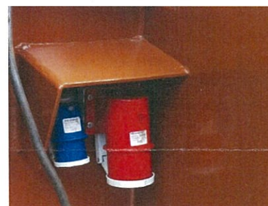
220 en 380 V walaansluiting