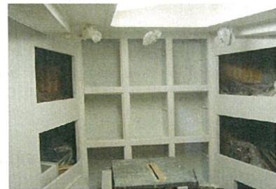
Vooronder in grondverf