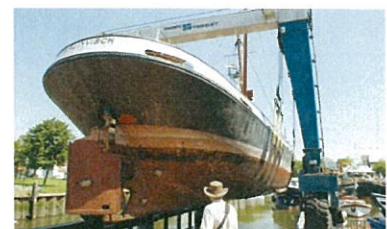
Droogzetten door Sjaak