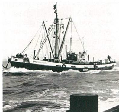
Bruinvisch anno 1956