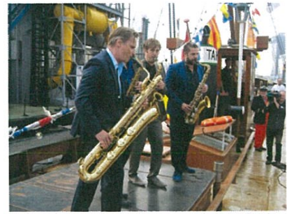
Muzikanten aan boord van de Bruinvisch tijdens het "Zwaar Metaal Concert"

Kort daarop was het alweer het eerste weekend van oktober en dus zoals vanouds weer Furiade in Maassluis. Na een storm- en regenachtig begin op vrijdag en aan het begin van de zaterdagochtend klaarde het weer toch al gauw weer op en stond niets een mooie dag meer in de weg. Op deze dag werden er weer diverse helmduik demonstraties door het team van "de Helmduiker" vanaf de Bruinvisch gegeven. Met daarbij ook nog een behoorlijk aantal bezoekers kon deze dag voor zowel het helmduik team als voor de bemanning niet meer stuk.