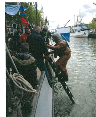
Een helmduiker in actie vanaf de Bruinvisch tijdens de Furiade van 2012