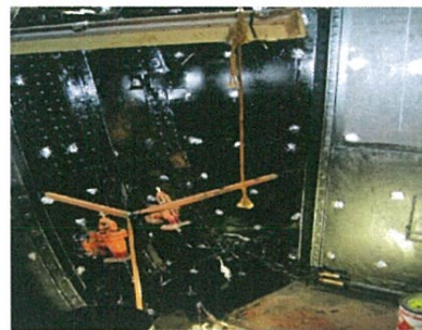
De sanitaire ruimte in aanbouw

Ook is er begonnen met het (her)inrichten van de stuurhut. Zo had de stuurkolom tot voor kort nog een tijdelijke houten omlijsting en was er provisorisch een roerstand aanwijzer aangebracht. In de komende maanden zal de stuurkolom worden afgewerkt met een hechthouten betimmering en wordt ook het dashboard, waarvan wij u een foto in een eerdere nieuwsbrief hebben laten zien, geïnstalleerd. Tevens zal nadat alle werkzaamheden in en rondom de stuurhut zijn uitgevoerd deze zowel aan de binnen- als aan de buitenkant weer van een verse lak laag worden voorzien.