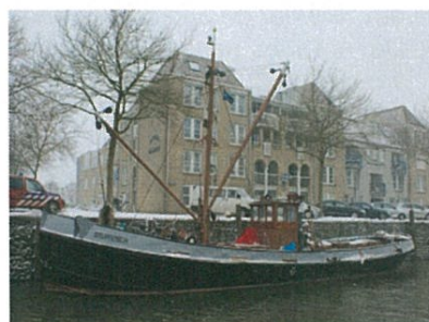
Bruinvisch anno 2013