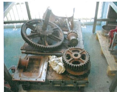
Het ankerlier volledig gedemonteerd