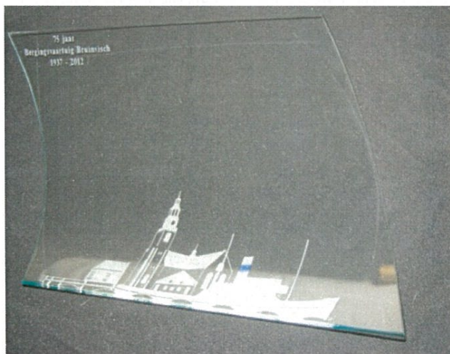
De bokaal van de Gemeente Maassluis, voor de 75 jarige Bruinvisch