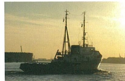
Onderweg van de Leuvehaven naar de thuishaven werd de Bruinvisch opgelopen door de Elbe, welke ook onderweg was naar de thuishaven