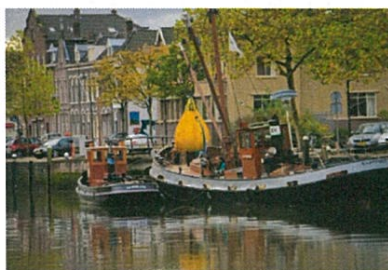
Testen hijsgerie met een waterzak