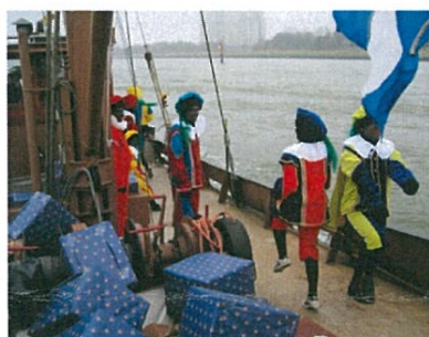
Sinterklaas intocht 2012