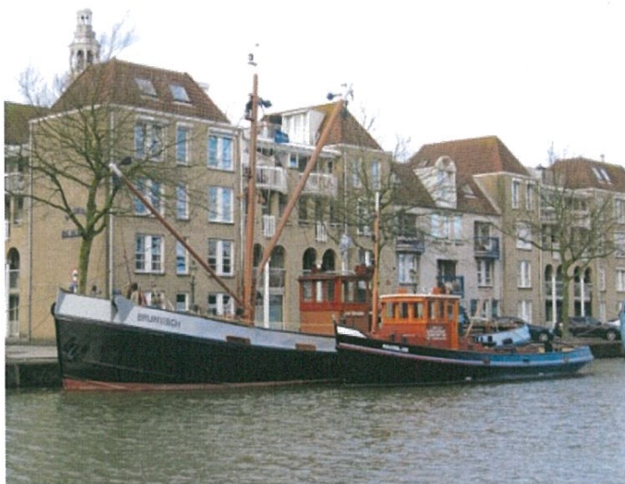
De Bruinvisch en het Maassluisje afgemeerd aan de Haringkade in de binnenhaven van Maassluis