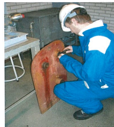
Een leerling van het STC controleert een onderdeel van het ankerlier op slijtage