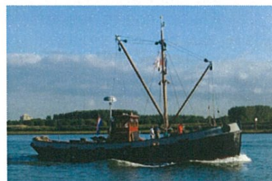
De Bruinvisch onderweg naar de Wereldhavendagen 2012