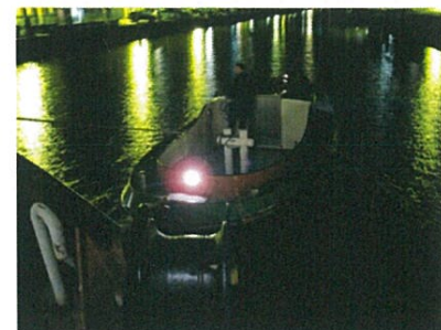
De Tarka 2 in actie tijdens het terugbrengen van de Bruinvisch naar de Haringkade

Zaterdag 18 mei Dag van de Zeesleepvaart!