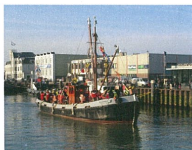
De pakjesboot 5 vaart de haven van Maassluis binnen