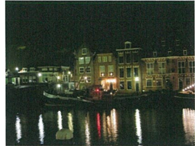
2de kerstdag 2012, 05.30 uur de Bruinvisch en Maassluis dobberend voor de Schansbrug