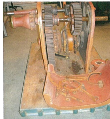
Het ankerlier in het begin stadium van de demontage

Ook zijn het onderdeks en de huid geïsoleerd en is het machinekamerschot in deze ruimte van een brandvertragende isolatie (A60) voorzien.