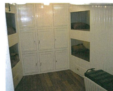
Het bemanningsverblijf werd in januari 2013 opgeleverd