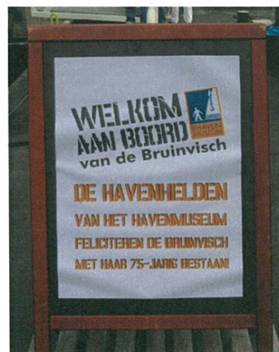
De Bruinvisch werd door "De Havenhelden" gefeliciteerd met haar 75 jarig bestaan