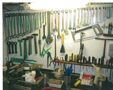
Het gereedschapsbord in de machinekamer