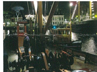
Het Maassluisje in actie tijdens het terugbrengen van de Bruinvisch naar de Haringkade