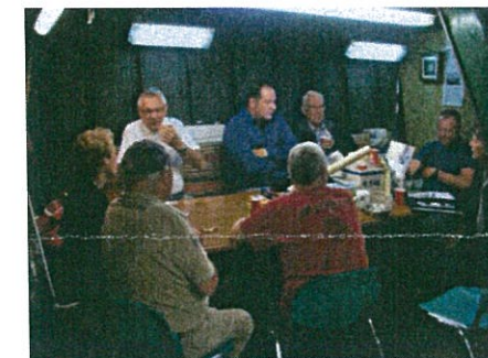
Werkoverleg aan boord