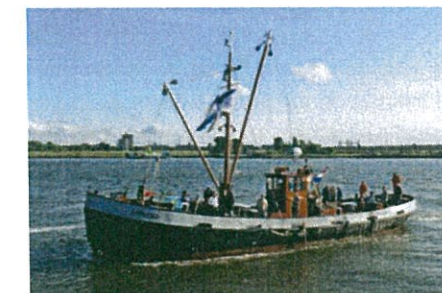
Onderweg naar evenement