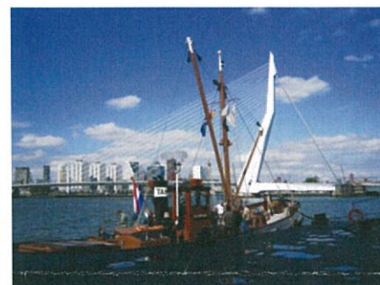
Voor de Erasmusbrug