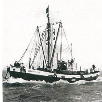
Bruinvisch anno 1956

Het achterruim is volledig ontroest, geconserveerd en geïsoleerd. Daarna is een houten wegering aangebracht op de spanten en het