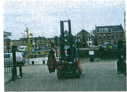
Bergingspomp gerevideerd op wea naar de Bruinvisch

Marjorystraat 11, 3151 JK Hoek van Holland www.bruinvisch.nl / info@bruinvisch.nl