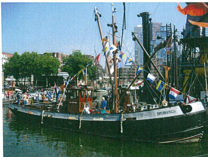
Afgemeerd in de Leuvehaven