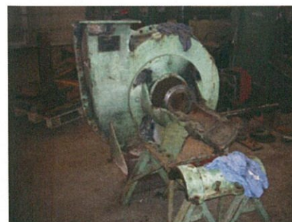
Bergingspomp tijdens revisie